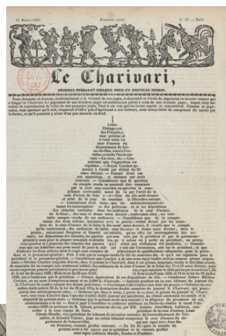
N o 58 du Charivari, 27 février 1834

La Charte constitutionnelle d'août 1830 précise que « les citoyens ont le droit de publier et de faire imprimer leurs opinions en se conformant aux lois » et que « la censure ne pourra jamais être établie ». Effectivement, la presse connaît un grand développement sous la monarchie de Juillet, se diversifiant avec la création de nombreuses revues et l'apparition d'une presse spécialisée (féminine, médicale...), introduisant la publicité dans ses financements, s'appuyant sur les premières agences d'information (Havas), fidélisant les lecteurs avec les romans-feuilletons. Cette modernisation a des limites: la presse continue d'être soumise au système du cautionnement et son impression reste encore artisanale. La censure est établie pour les dessins de presse portant offense au roi par la loi du 9 septembre 1835: La Caricature , Le Charivari de Charles Philippon, avec ses caricatures en poire de Louis-Philippe, deviennent les organes d'opposition à la monarchie de Juillet et ne cessent d'être poursuivis en justice.