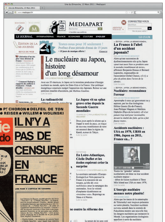
Mediapart, 13 mars 2011 © Mediapart.

Finalement la loi de 1881 ne cesse d'être amendée au gré des difficultés de l'État à assurer son pouvoir, mais aussi en fonction de l'évolution des mœurs. D'autres lois viennent encadrer la liberté d'expression : la loi Gayssot de 1990 contre les propos racistes, négationnistes, révisionnistes, la loi du 30 décembre 2004 contre tout propos haineux en raison du sexe, de l'orientation sexuelle ou du handicap... L'enjeu législatif semble donc aujourd'hui surtout de préciser ce qu'est la liberté d'expression. Or elle est revendiquée, sans aucune restriction, par les utilisateurs d'Internet, moyen de diffusion de l'information difficile à contrôler. C'est alors même le métier de journaliste qui est concurrencé : sommes-nous tous journalistes en rendant compte sur Internet d'un événement dont nous sommes témoins ? N'avons-nous pas davantage besoin aujourd'hui, dans la profusion des informations auxquelles nous avons accès, de médiateurs ?