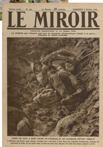
Une du Miroir , Sur le front, 8 octobre 1916, n° 150 BnF, Estampes et Photographie, QE-839-PET FOL