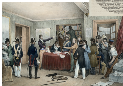
Saisie des presses au National , le 27 juillet 1830 BnF, Estampes et Photographie, RÉSERVE QB-370(87)-FT4

Le XIX e siècle oscille entre reconnaissance de la liberté de la presse, revendiquée surtout par les élites, et censure, afin de limiter toute opposition politique. L'Empire rétablit la censure et les journalistes sont très souvent condamnés. La Restauration hésite : la censure est appliquée tantôt de manière stricte, tantôt plus souplesment; et surtout la loi de Serre de 1819, qui établit le système de cautionnement (dépôt destiné à garantir d'avance le paiement des pénalités), limite la création de nouveaux journaux. Les ordonnances du roi Charles X du 25 juillet 1830 contre la liberté de la presse déclenchent notamment l'agitation populaire à Paris et la Révolution de Juillet. Le National et Le Temps , les deux principaux journaux d'opposition à la politique de Charles X, sont supprimés, leurs presses détruites. Mesures inutiles car le mouvement révolutionnaire est déjà en marche; la liberté de la presse est alors définitivement considérée comme une liberté fondamentale pour la démocratie française.