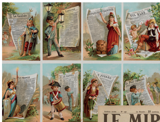
Planche de vignettes chromolithographiques présentant les principaux titres de presse des années 1890 BnF, Estampes et Photographie, MD MAT-3 BOÎTE PET FOL