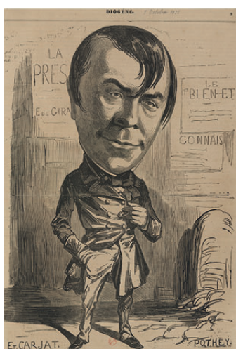
Portrait-charge d'Émile Girardin, 1836

Pendant l'entre-deux-guerres, la presse écrite entre dans une première période de crise : sa diffusion stagne. Et pourtant, à la fois concurrencée par les actualités filmées, la radio (à partir de 1921), et par la télévision (à partir de 1937), et en retard techniquement, la presse régionale et hebdomadaire se maintient et participe à tous les mouvements idéologiques de cette période de tensions politiques. De même, la loi Brachard de 1935 instaure le statut de journaliste professionnel, garantie de l'indépendance de cette profession. Mais la déontologie doit encore progresser : après le suicide de Salengro, homme politique calomnié dans les journaux, une modification est introduite dans la loi de 1881, aggravant les peines pour diffamation et appel au meurtre.