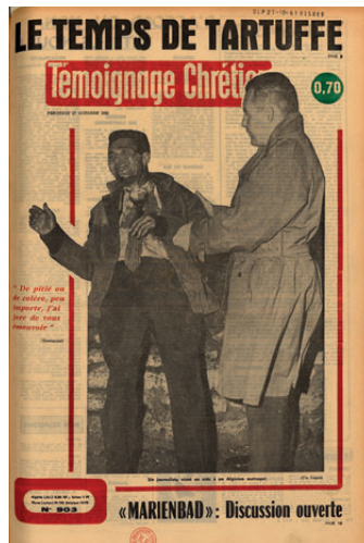
Une de Témoignage chrétien , n° 903, 27 octobre 1961 BnF, Droit, Économie, Politique, GR FOL-Z-209

Avec le vote de la loi sur l'état d'urgence en 1955 dans le contexte de la guerre d'Algérie, c'est le retour de la censure en France : les préfets ont pouvoir de prendre toute mesure pour contrôler la presse. Cependant, de nouveau, comme pendant la Première guerre mondiale, on observe le même phénomène d'autocensure des journaux, en particulier lors de la manifestation d'Algériens au métro Charonne en octobre 1961. Peu de journaux ont le courage ce jour-là, comme ici Témoignage chrétien , de dénoncer les violences policières à Paris. Peu de journaux ( Le Monde , France Observateur , L'Express ) osent parler de guerre au lieu d'« opérations de maintien de l'ordre » et dénoncer l'utilisation de la torture, dénonciation pourtant faite au nom des droits de l'homme, bien loin du secret défense.