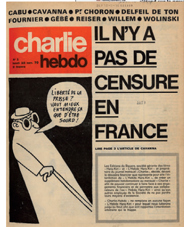
Une de Charlie hebdo , n° 1, 23 novembre 1970 BnF, Droit, Économie, Politique, FOL-LC2-7314

Depuis le XIX e siècle, caricatures et dessins de presse sont extrêmement surveillés par les pouvoirs publics. Où se placent en effet les limites entre l'irrévérence et les atteintes aux personnes, la diffamation ? Qui en juge ? Apportant un second degré en une ou spécialité satirique d'un journal, ces dessins sont « une des forces les plus vives de l'argumentation » (Champfleury) et témoignent de la liberté d'expression. Cette liberté de ton est pourtant censurée : à la mort de De Gaulle, l'hédomadaire Hara-Kiri , alors que la presse est unanime pour faire l'éloge du grand homme, publie en une : « Bal tragique à Colombey : un mort. ». Cette indécatesse, se moquant aussi du traitement des faits divers dans les journaux, vaut l'interdiction du journal. En réaction, Charlie hebdo est lancé et inscrit dans un esprit provocateur à sa une : « Il n'y a pas de censure en France. »