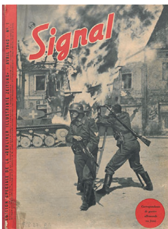
Une de Signal , n° 1, avril 1940 BDIC

Avec l'occupation allemande et le régime de Vichy, la presse subit un contrôle particulièrement strict, toute liberté d'expression est rendue impossible dans ces systèmes totalitaires : certains journaux se sabordent pour ne pas se corrompre, d'autres sont interdits. Conscients de l'importance du contrôle des esprits, certains titres diffusent la propagande allemande, collaborent ; d'autres soutiennent le régime de Vichy. Signal est ainsi un journal nazi traduit en vingt-cinq langues et diffusé dans tous les pays occupés. Mais le lectorat se détourne de cette presse officielle et recherche dans la clandestinité d'autres informations. La Résistance se fait aussi dans les journaux, clandestins au risque de leur vie pour ces journalistes, typographes, imprimeurs et aussi ceux qui transportent et distribuent ces journaux de la Résistance.