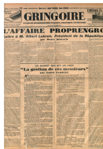
Une de Gringoire , déclenchant avec l'Action française, l'affaire Salengro, n° 418, 6 novembre 1936 BnF, Droit, Économie, Politique, GR FOL-Z-142