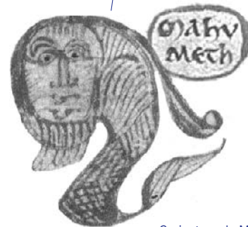
Caricature de Mahomet