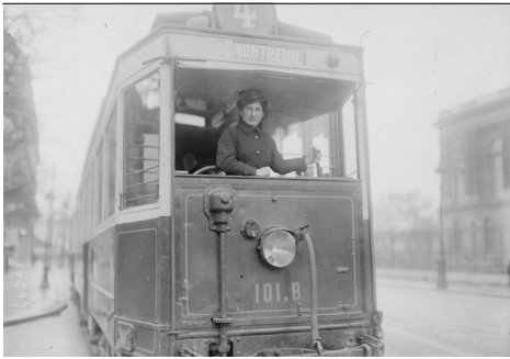
Photographie de presse (négatif sur verre, 13 x 18 cm). Agence photographique Rol, 1917. BnF, Estampes et photographie, Rol, 50647 http://gallica.bnf.fr/ark:/12148/btv1b53004005t