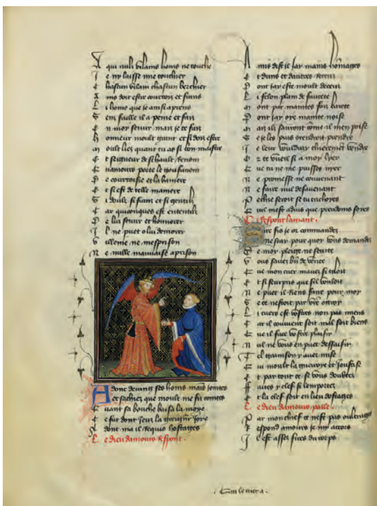
Amour sacré, amour profane

Le Roman de la Rose BnF, Ms fr., 12 595, f° 16 v°