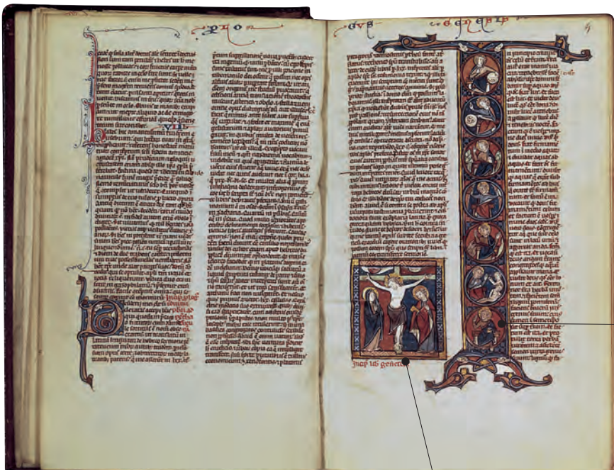
Bible latine Paris xiii e siècle (vers 1240-1255) BnF, Ms lat., 16 265, f o 4

Dans le compartiment du bas, saint Louis , destinataire du psautier, identifiable à sa couronne et au fond clouté de fleurs de lys, est représenté en prière, à genoux devant le Christ en majesté entouré d'une mandorle d'or. C'est saint Louis, ce pourrait être David repentant.