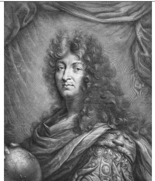
Louis XIV tenant un globe, 1687, gravure, Paris, BnF, Estampes, N5 (Louis XIV). Le globe terrestre, symbole du pouvoir absolu de Louis XIV, monarque de droit divin.

Or pour les principaux souverains, les enjeux de la cartographie ne cessent de s'accroître avec la constitution des empires coloniaux par des royaumes comme le Portugal (côte orientale de l'Afrique, littoral indien et Brésil), l'Espagne (Philippines, Mexique, Amérique centrale, détroit de Magellan), les Pays-Bas (Australie, Ceylan, Java), la France et la Grande-Bretagne (Amérique du Nord et océan Indien).