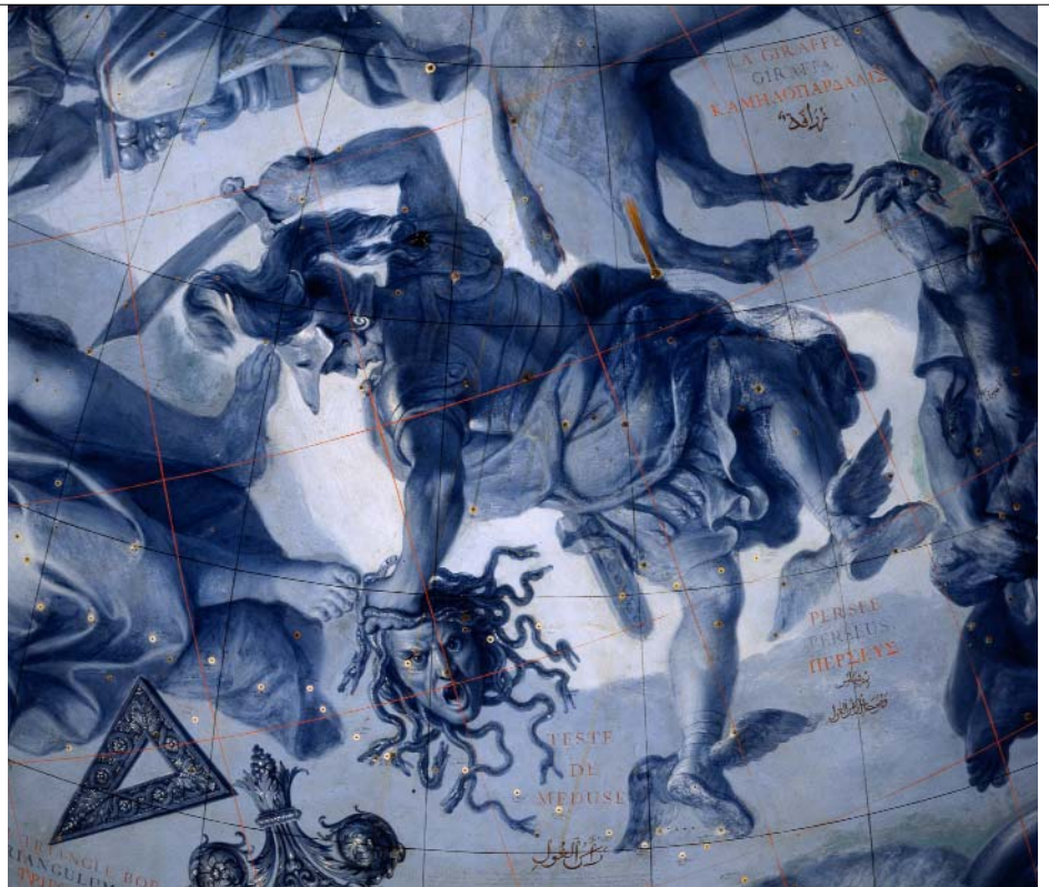
Persée et Méduse

Il s'agit d'un globe de type convexe fondé sur la conception de l'univers de Ptolémée (géocentrisme) : par convention, la Terre se situe au centre de l'univers, entourée par les étoiles et les constellations. Par rapport au globe céleste de Coronelli, le spectateur ne se situe pas sur la Terre mais à l'extérieur de ce système. Dans la réalité, les étoiles sont fixes et la Terre tourne sur elle-même (24 heures) et autour du Soleil (en une année). Ainsi, pour traduire le mouvement de la Terre ainsi que l'inclinaison de l'axe des pôles terrestres, Coronelli a incliné la sphère céleste et l'a faite tourner sur elle-même : ici ce sont donc, à l'inverse de la réalité, les constellations qui tournent autour de la Terre qui correspondrait au centre du globe céleste. De la même manière, pour matérialiser le plan de l'écliptique défini par la rotation de la Terre autour du Soleil, Coronelli a placé sur le globe céleste un grand cercle de bronze incliné de 23° 27' sur l'équateur et sur lequel coulisse un Soleil à une dimension proportionnelle à celle qu'il a, vu de la Terre. Ce cercle traverse les constellations du Zodiaque et permet de comprendre la succession des saisons à la surface de la Terre. Normalement, les constellations figurées sur un globe de type convexe devraient tourner