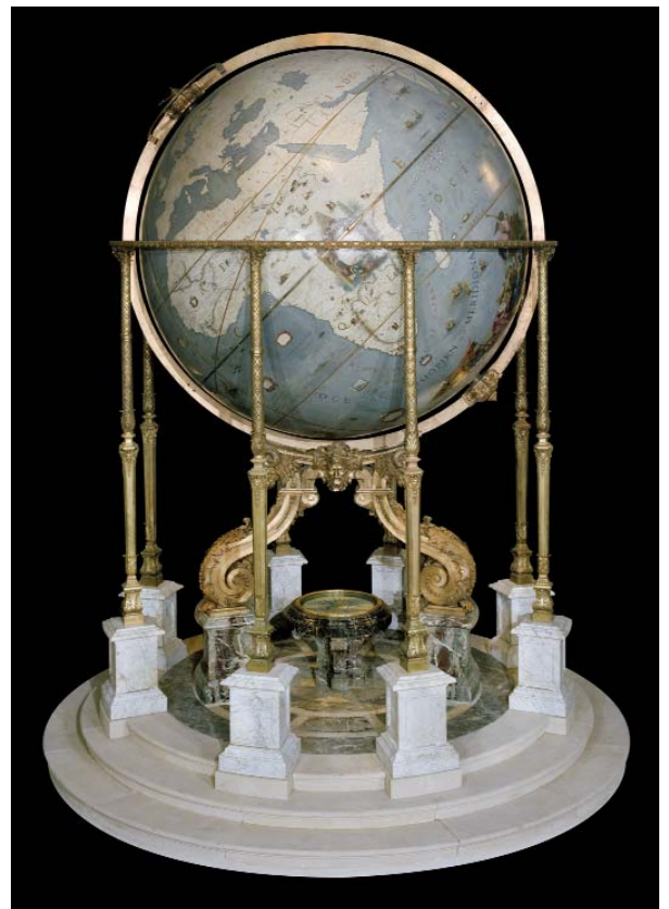
Une vue générale du globe terrestre sur son support avec méridiens. De véritables instruments conçus pour fonctionner malgré leur poids et leur taille.