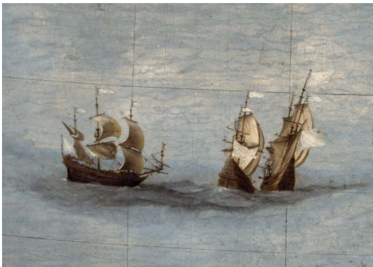
Flotte de vaisseaux. La cartographie constitue l'outil essentiel au service de l'essor des échanges maritimes commerciaux.