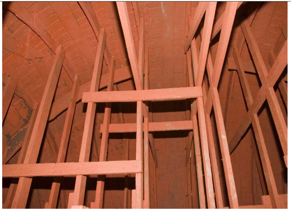
Une vue de l'intérieur du globe terrestre. Les secrets d'une prouesse technique d'ébénisterie.

La fabrication des globes s'est effectuée principalement lors de deux périodes : de 1681 à 1683 à Paris pour la construction et la peinture des sphères, puis en 1703-1704 à Marly pour la réalisation des supports et l'achèvement de la décoration.