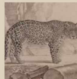
Georges-Louis Leclerc Buffon