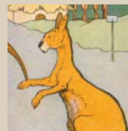
Benjamin Rabier