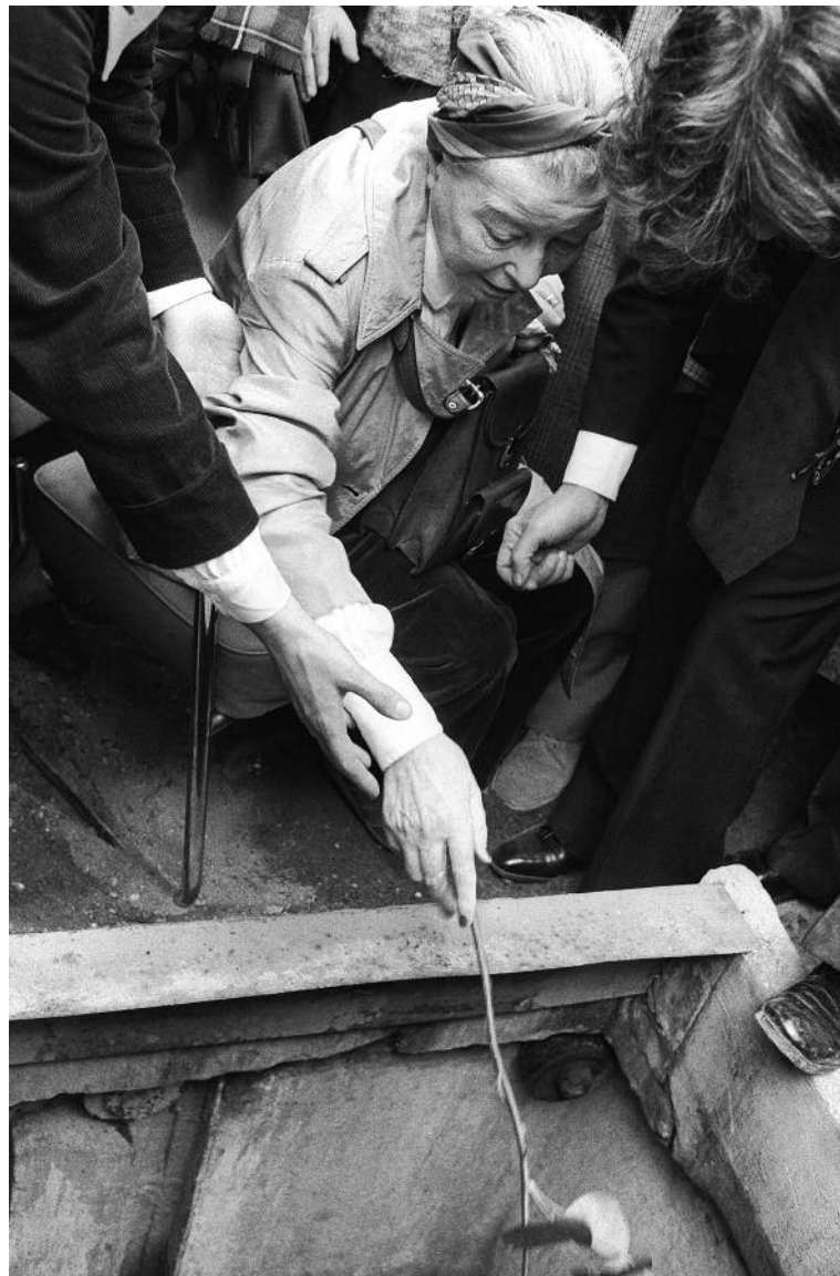
Simone de Beauvoir à l'enterrement de Sartre

Sartre, engagé dans la défense de beaucoup de causes, n'a jamais défendu directement celle des femmes et c'est surtout sa compagne qui théorise l'idée d'une relation moderne qui n'asservit pas la femme. Simone de Beauvoir énonce clairement son rejet du couple traditionnel dans ses Mémoires en s'appuyant sur l'exemple de Nizan : « J'aperçus un jour au Luxembourg Nizan avec sa femme qui poussait une voiture d'enfant, et je souhaitai vivement que cette image ne figurât pas dans mon avenir. » Le couple Sartre-Beauvoir est en partie une construction populaire qui ne tient pas compte des amours « contingentes », élément pourtant fondamental du pacte amoureux. À l'enterrement de Sartre, le public voit en Simone de Beauvoir l'unique veuve de Sartre.