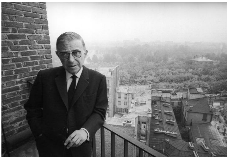
Je me sens chez moi à Montparnasse. Sartre, Situations X