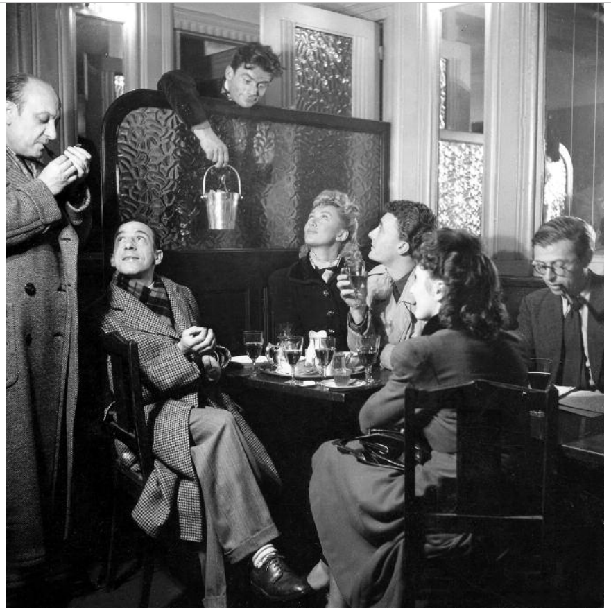
Sartre avec des comédiens au Café de Flore

À cette époque cependant, le couple vit à Montparnasse. La Coupole ouvre en 1927 et Sartre vit alors non loin de là, dans de petits hôtels meublés rue de Cels, entre le cimetière du Montparnasse et l'avenue du Maine, puis rue de la Gaîté. C'est le Dôme qu'ils élisent comme quartier général : Sartre y écrit et s'y fait adresser son courrier, s'y sent chez lui. Comme Mathieu, dans Les Chemins de la liberté , l'écrivain, dès sa mobilisation, émigre progressivement vers Saint-Germain-des-Prés. Depuis le Front populaire, le quartier connaît un nouvel essor et concentre l'activité littéraire. Le Café de Flore rassemble alors plutôt des