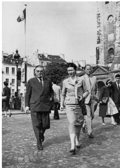
Sartre et Beauvoir à Saint-Germain-des-Prés

appartement situé au 42, rue Bonaparte, partagé avec sa mère devenue veuve, madame Nancy : Sartre écrit alors davantage dans son bureau que dans les cafés. Cette forme de sédentarisation s'accompagne de l'achat de livres, de l'installation d'une bibliothèque, du recours à un secrétaire : le nomadisme et le refus de la possession s'estompent quelque peu. L'écrivain quitte ce quartier en 1962 après le plasticage de son appartement, pour revenir à Montparnasse.