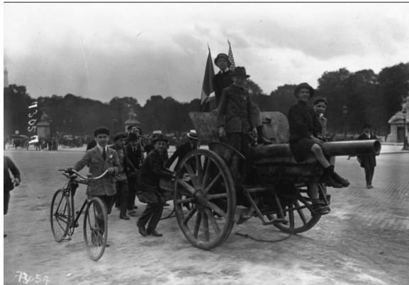
Place de la Concorde, enfants traînant un 77 boche Agence photographique Meurisse, 1919

Ville de Paris / Fonds Heure joyeuse, 2013-44926 http://gallica.bnf.fr/ark:/12148/bpt6k65116692/f32 Provenance : bnf.fr